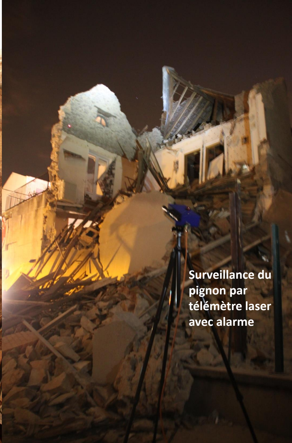
Surveillance du pignon par télémètre laser avec alarme